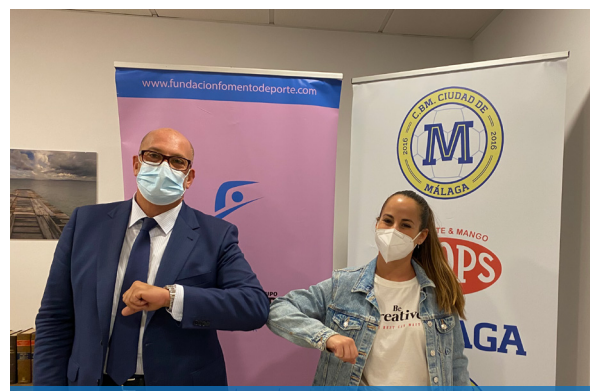
Colaboración con el Club de Balonmano Ciudad de Málaga. Aportación destinada a los gastos de la temporada puesto que están en división de honor plata. Septiembre 2019 y 2020.