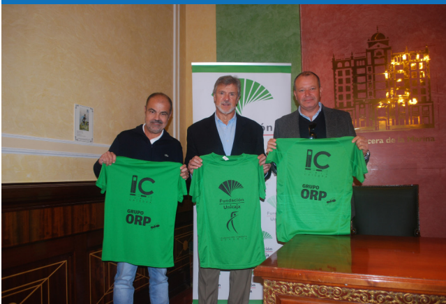
Firma de convenio de Colaboración en septiembre de 2018 para ayudarnos a seguir creciendo.