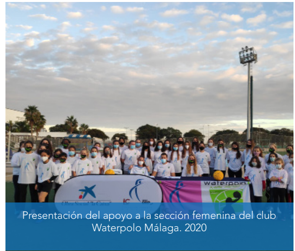
Presentación del apoyo a la sección femenina del club Waterpolo Málaga. 2020