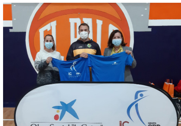
Equipo Femenino Basket for Life: Becas de estudio para las chicas del equipo. Octubre 2020.