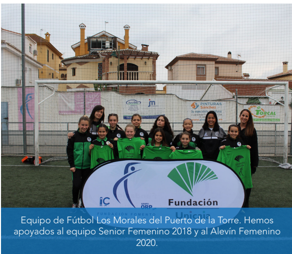
Equipo de Fútbol Los Morales del Puerto de la Torre. Hemos apoyados al equipo Senior Femenino 2018 y al Alevín Femenino 2020.