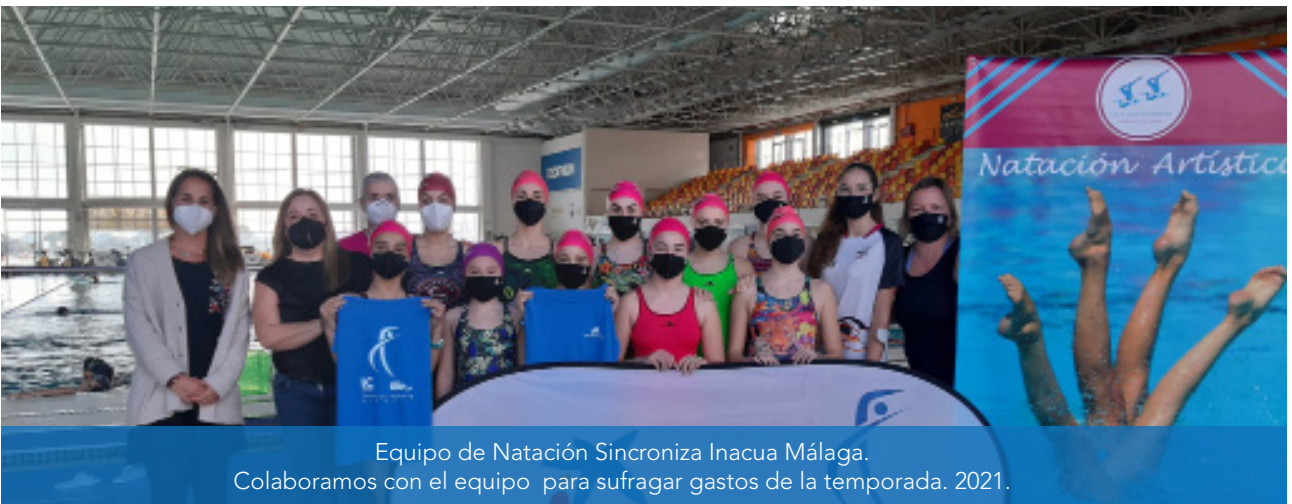
Equipo de Natación Sincroniza Inacua Málaga. Colaboramos con el equipo para sufragar gastos de la temporada. 2021.