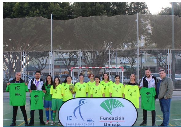
Fútbol Sala Distrito 7: Colaboramos con el equipo Senior Femenino y equipamiento para el Club. Marzo 2020.