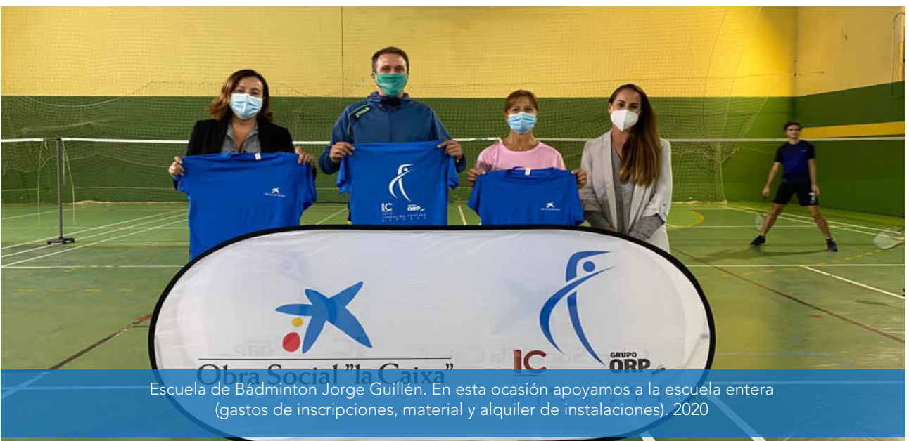
Escuela de Bádmin-ton Jorge Guillén. En esta ocasión apoyamos a la escuela entera (gastos de inscripciones, material y alquiler de instalaciones). 2020