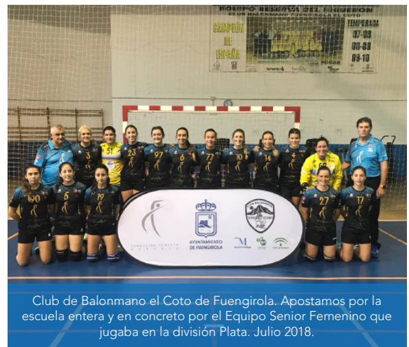
Club de Balonmano el Coto de Fuengirola. Apostamos por la escuela entera y en concreto por el Equipo Senior Femenino que jugaba en la división Plata. Julio 2018.