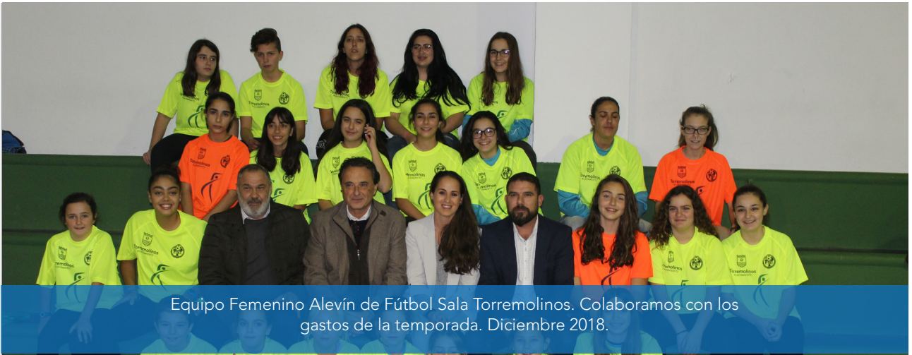
Equipo Femenino Alevín de Fútbol Sala Torremolinos. Colaboramos con los gastos de la temporada. Diciembre 2018.