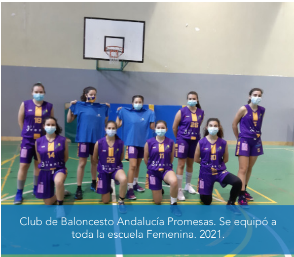
Club de Baloncesto Andalucía Promesas. Se equipó a toda la escuela Femenina. 2021.