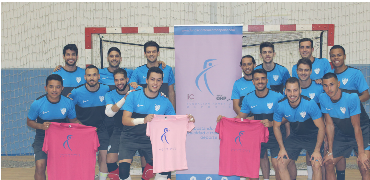
Para la temporada 2020/2021 firmamos convenio de colaboración con el Málaga C.F. Fútbol.