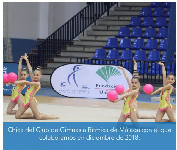
Chica del Club de Gimnasia Rítmica de Málaga con el que colaboramos en diciembre de 2018.