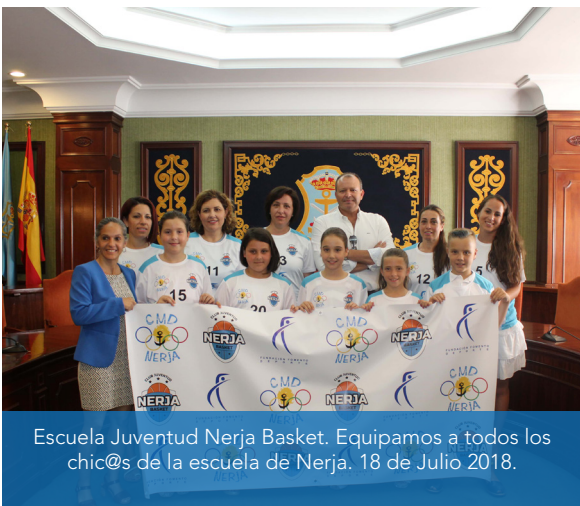
Escuela Juventud Nerja Basket. Equipamos a todos los chic@s de la escuela de Nerja. 18 de Julio 2018.