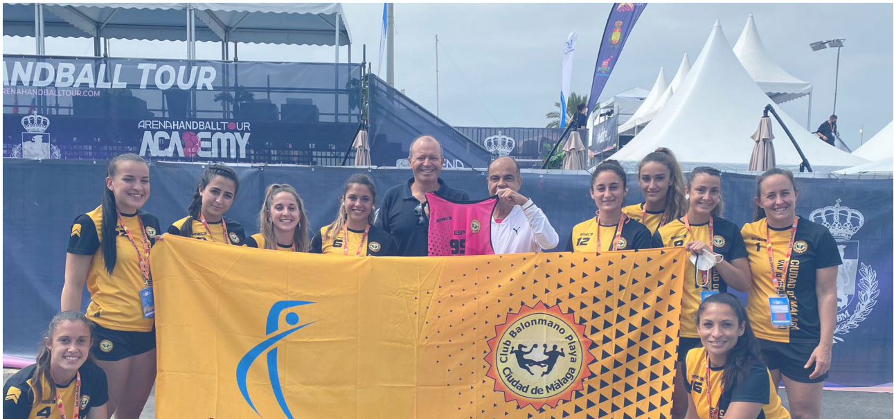
Patrocinio de los 14 equipos de la escuela del Club Balonmano Playa Ciudad de Málaga. Julio 2019 - junio 2021.